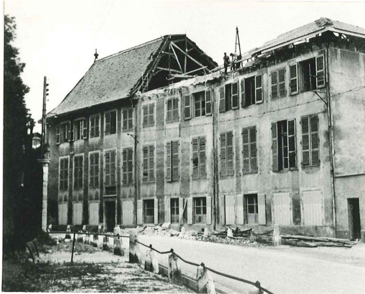
Le château en 1954

La toiture et le plancher sont refaits en 1956. Un projet d'installation de bureaux pour les Ponts et Chaussées est dessiné.