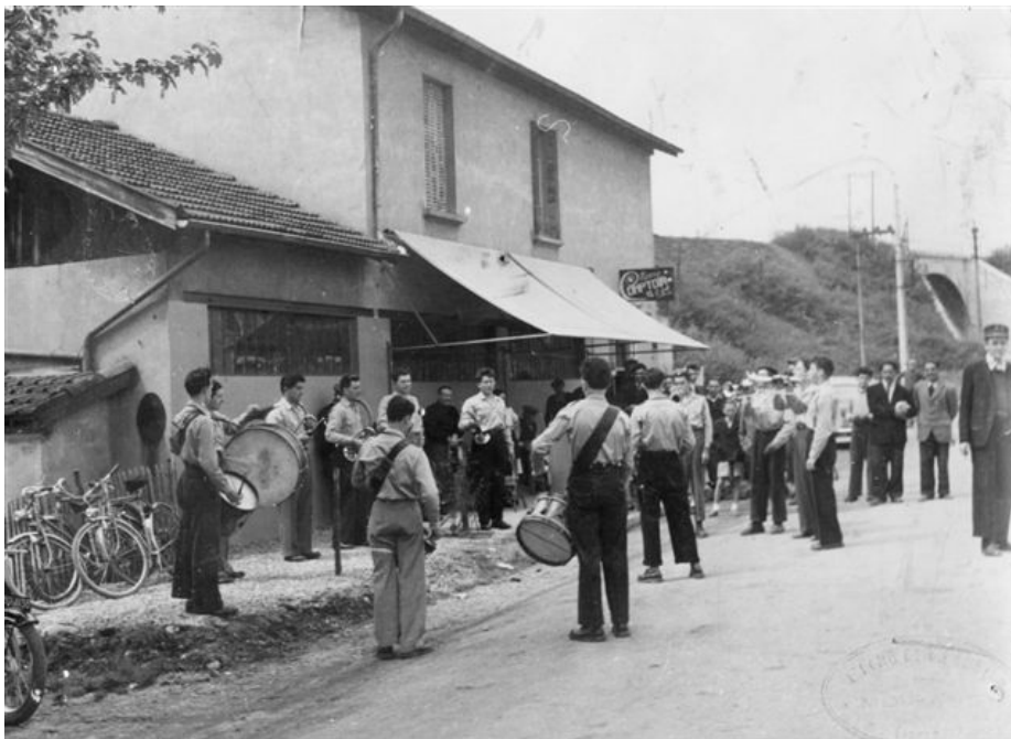
Une commune libre « la commune du viaduc » active et festive a rythmé la vie du quartier dans les années 50.

Face aux Tuileries, une usine à gaz. Chaque soir, et jusque dans les années 40, un employé de la Société, muni d'une longue perche allumait les becs à gaz de la ville. Plus moderne que l'éclairage au pétrole, le gaz est, lui aussi, peu à peu remplacé par l'électricité.