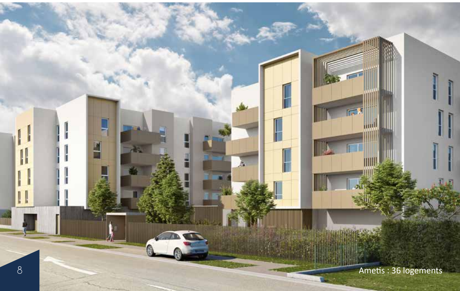
Ametis : 36 logements

missions à laquelle la ville s'est employée.