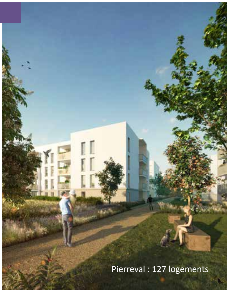
Pierreval : 127 logements

Les cellules familiales se modifient et voient leur besoin s'accroître lors de décohabitations ou recompositions familiales. Il faut développer une offre plus importante de logements, ne serait-ce que pour maintenir nos familles sur le territoire communal. Les délais de construction étant longs, c'est une des premières